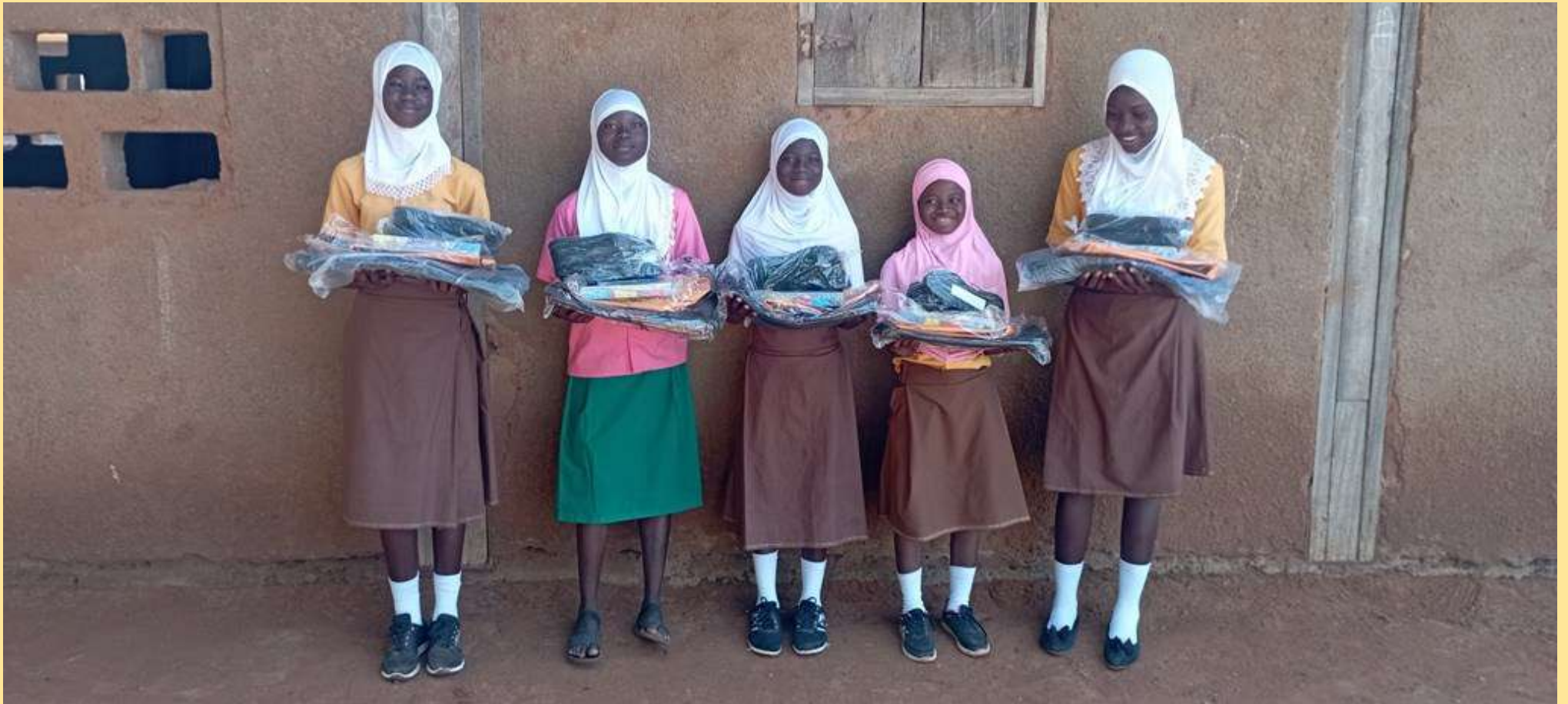
Otroci iz programa ob prejemu šolskih potrebščin in uniform.